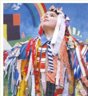
PRIX JEUNES CRÉATEURS