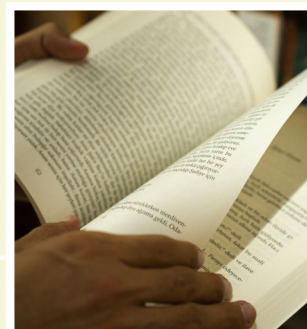
PRIX TEXTES CLAMÉS & CONTES