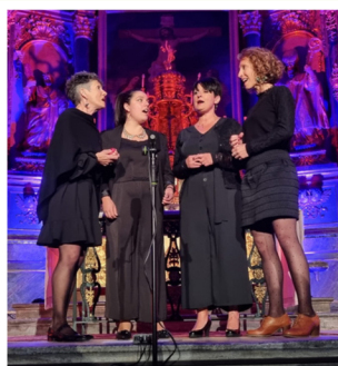
PRIX GROUPES & CHORALES