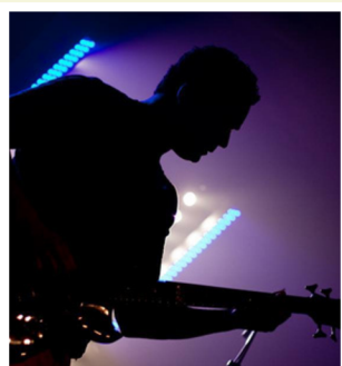
PRIX MUSIQUES AMPLIFIÉES

VALORISEM LAS VÒSTAS CREACIONS ARTISTICAS EN ÒC !