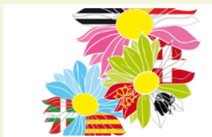
PRIX LANGUES VERNACULAIRES