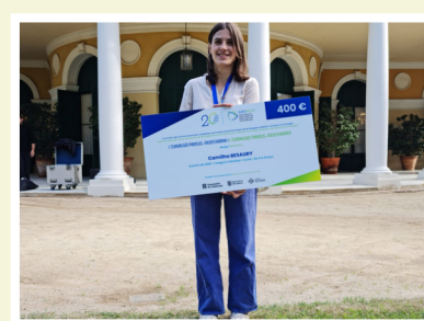
PRIX PORTEURS DE LANGUE